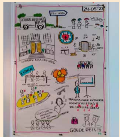
DEN HAAG & GOOI

DEN HAAG & HET GOOI. Het voorjaars-uitje de van de lutherse gemeente Het Gooi ging deze keer naar Den Haag. Het thema werd aangereikt vanuit een studieproces van de Lutherse Wereldfederatie naar hoe gevarieerd het 'luthers-zijn' is in de veelkleurigheid waarop ons geloof wereldwijd in de lidkerken van de Lutherse Wereldfederatie beleefd wordt. Zowel in Den Haag als bij de Lutheranen uit het Gooi werd het als heel inspirerend ervaren.